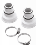
PVC-Steckverbinder Ø 32-38m