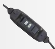
5m elektrische Steckdose mit 10 mA-Differentialschutz